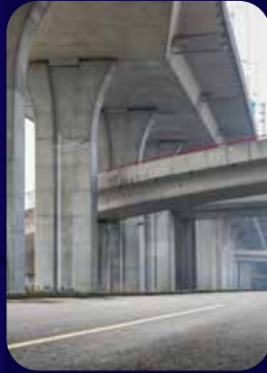
تصميم الطرق والجسور