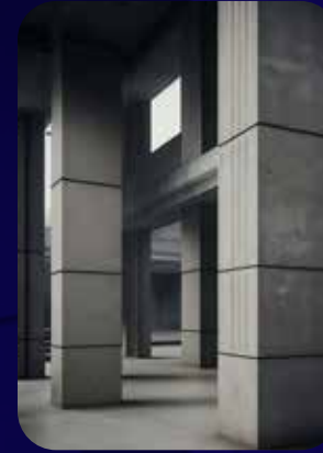
تصميم المنشآت الخرسانية