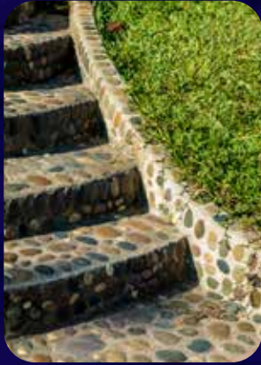
اللاندر سكيب وتنسيق الموقع