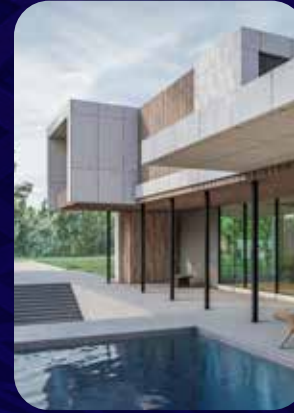
تصميم الواجهات الخارجية