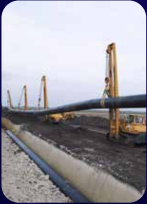
الهندسة الصحية والبنية التحتية

نقوم بعمل التحليل الإنشائي والنوتة الحسابية وإخراج المخططات التصميمية والتنفيذية لمختلف قطاعات الهندسة المدنية مع مراعاة اشتراطات ومتطلبات كود البناء السعودي وتشمل خدماتنا التالي: