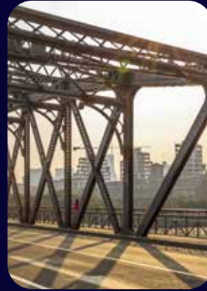
تصميم المنشآت المعدنية